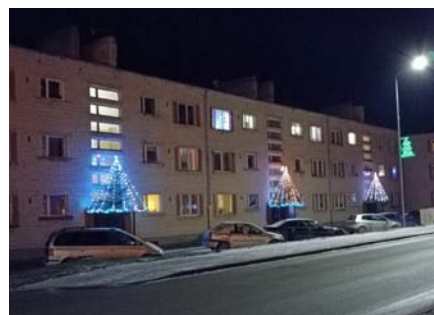
Rīgas iela 19