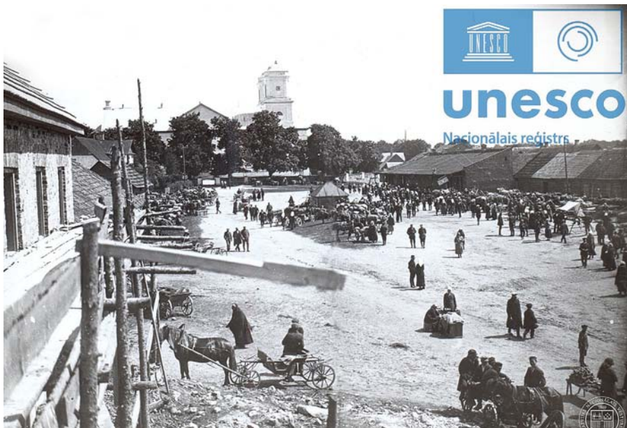
Tirgus dienas aina Rēzeknes apriņķa Varakļānos. 1926. gada 11. jūnijs.