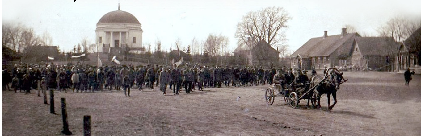
Pret Sv. Viktora kapelu.

Varakļāni pirmo reizi vēstures avotos minēti 1483. gadā. Jau tolaik šīs zemes piederēja grāfu Borhu dzimtai. Tolaik te saimniekoja Livonijas ordeņa mestrs Bernhards fon der Borhs. Varakļānus tolaik zināja ar nosaukumu Warkland (Varkas zeme).