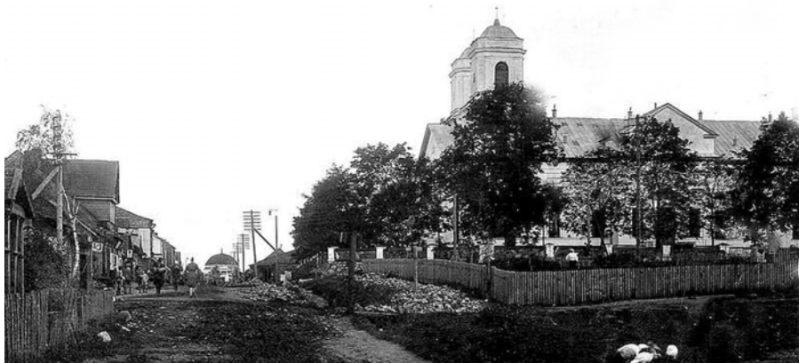
Skats uz katoļu baznīcu.