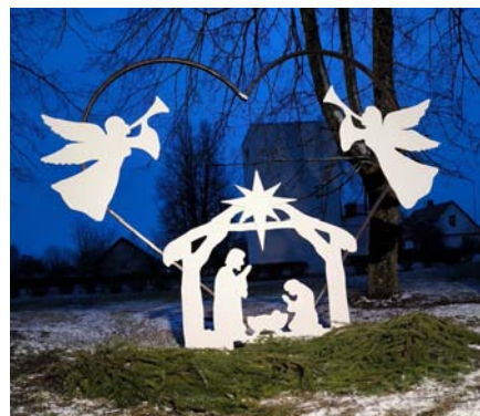
1. Maija laukums