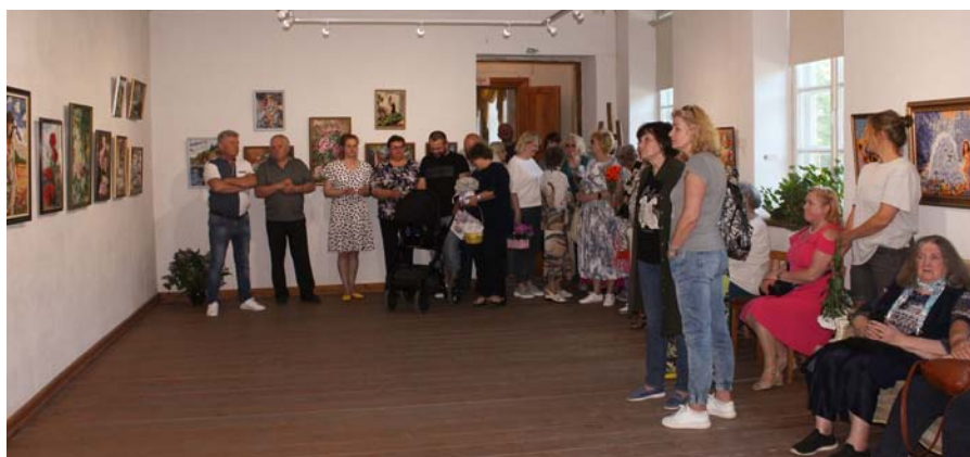
Muzeju nakts 2024